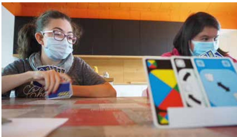
"Momenti ludici e non solo"

Le attività sono progettate, condotte e gestite dagli educatori che sono supportati, nelle attività artistiche dalla maestra d'arte. Le proposte vengono realizzate in gruppi la cui composizione numerica può variare secondo l'attività in: piccolo gruppo (da 3 a 5 persone) – medio gruppo (da 6 a 10) – grande gruppo (oltre le 10 persone).