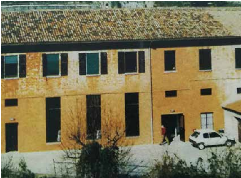
"La filanda di Noivoiloro"

Questo cambiamento si è reso necessario in risposta alle nuove normative regionali, che hanno meglio delineato il profilo dei Servizi rivolti alle persone disabili. È stato uno stimolo importante per riflettere sulla direzione da prendere, sulla ricerca continua dei possibili modi di operare, soprattutto nella relazione con e per le persone disabili, con i loro familiari e con i contesti di vita che li vedono protagonisti.