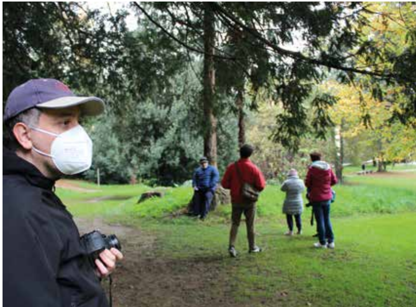
Un momento di ben-essere: "fotografie nel parco"