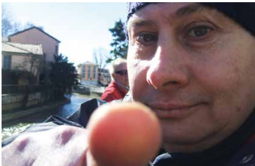
"Punto il dito verso te"

La quantità e il tipo di reclami ricevuti nel corso dell'anno operativo, unitamente all'esito e alle azioni conseguenti, costituiranno indicatori rilevanti della qualità del Servizio e del livello/qualità della relazione e della comunicazione tra Famiglie e Cooperativa.